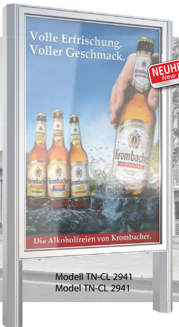
Modell TN-CL 2941 Model TN-CL 2941