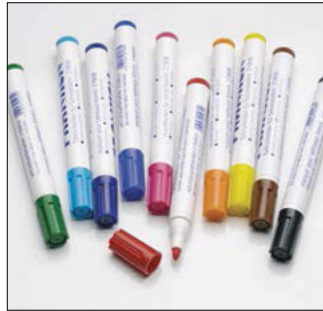
Zubehör: Faserstifte zum Beschriften weißer Script-Tafeln. Accessories: Felt markers for writing on white script boards.