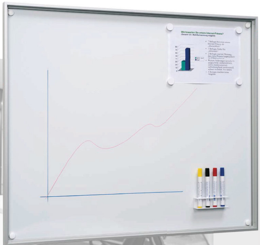
Modell KN 8 Model KN 8