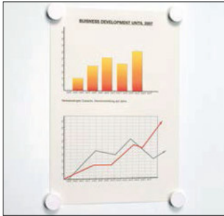
Magnethaftendes Whiteboard. Magnetic whiteboard.