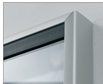
SOFTLINE gerundete Profile. SOFTLINE rounded profile.

Softline – Profil in modernem Design. Abgestimmt auf DIN A4-Aushänge. Für innen zur Wandmontage.