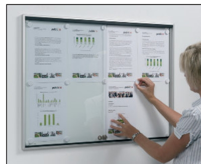
Standardgrößen abgestimmt auf DIN A4-Formate. Standard sizes designed for DIN A4 formats.